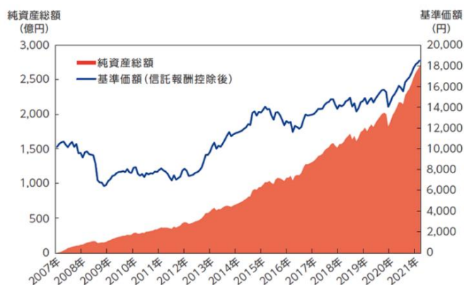
運用状況 (2007年3月15日～2021年6月30日)

世界 30 カ国以上の株式と、10 カ国以上の債券、合わせて 3,000 銘柄以上に分散投資し、これひとつで国際分散投資が可能です。株式と債券の比率は 50:50 で、値動きの緩やかな債券を半分入れることにより、リスクを抑えながら安定したリターンを獲得を目指します。株式と債券の比率は毎日確認し、必要な場合には随時リバランスを行います。世界最大級の運用会社であるバンガードのインデックスファンドのみを組入れ、国・地域別配分は株式および債券市場の時価総額(規模)を考慮しセゾン投信が決められています。