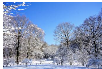
<春夏秋冬、一年を通して、赤城自然園は豊かな彩りに包まれます>