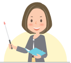
顧客サービスユニット 手計

実は、2年前にこのイベントに行きましたが、風の影響で、どちらも見る事ができませんでした。今年は規模を縮小して行われるようですが、また来年以降リベンジしたいと思います。